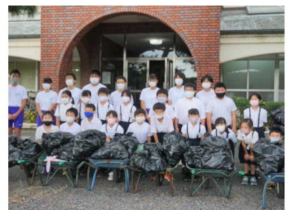
【 アルミ缶回収 】