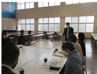
【 学校運営協議会 】