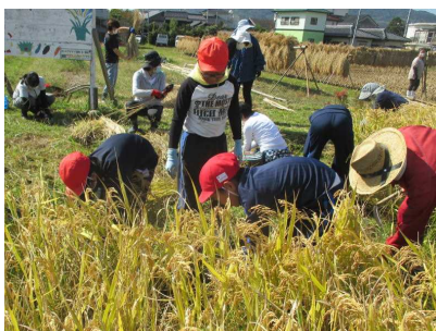
【 米づくり 】